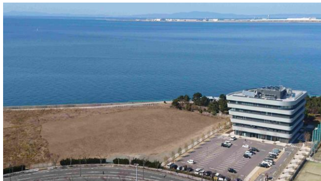
メディカルりんくうポート南側のりんくう公園建設予定地（大阪府所有地）に場外ヘリポートを設置。