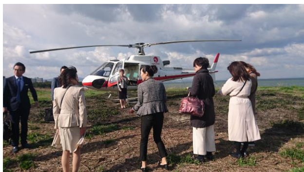
アテンダントが搭乗時と降機時の注意を説明