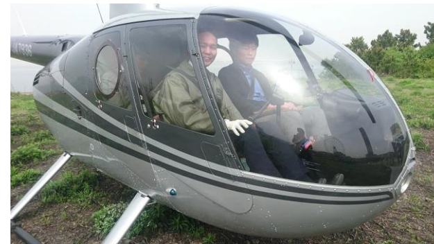
乗客3名乗り（シルバー）と5人乗り（紅白）のヘリコプター機体を使用。