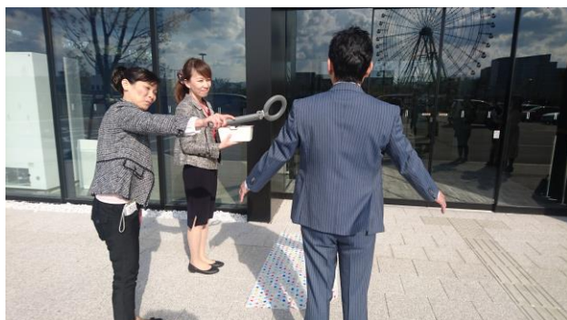
乗合の場合はボディチェックを実施