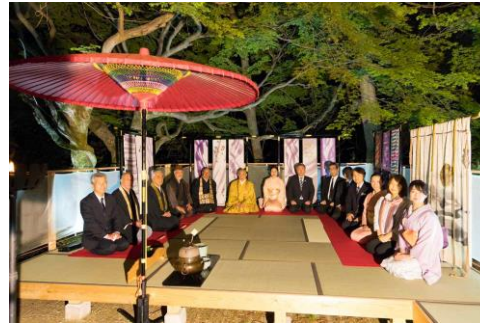
裏千家教授による豊臣秀吉の大花見茶会を再現した夜会