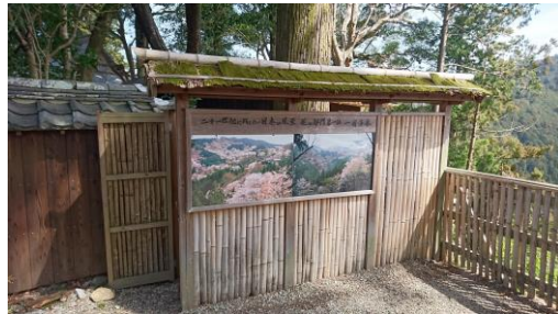
世界遺産・吉水神社に当社が新設した「一目千本茶屋」