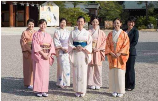
VIPコンシェルジュチーム