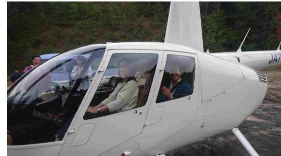
3人乗りヘリコプター