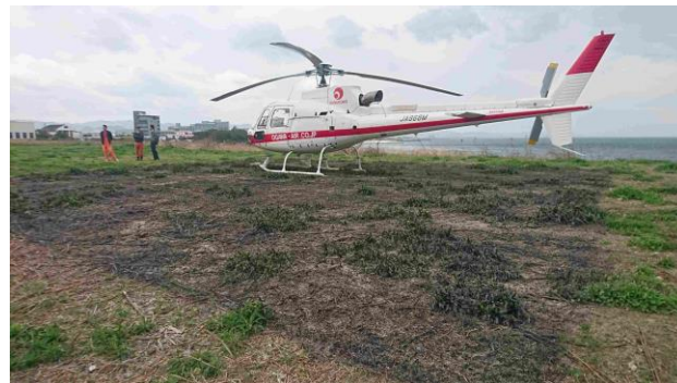
場外ヘリポートの地表1000㎡にアスファルト乳剤（環境適合製品）を専門事業者が噴霧し、砂飛散を防止。