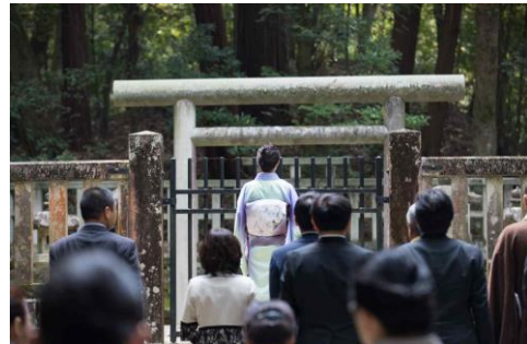
後醍醐天皇 即位700年記念献茶会