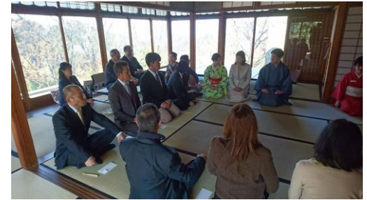
非公開文化財・白雲荘