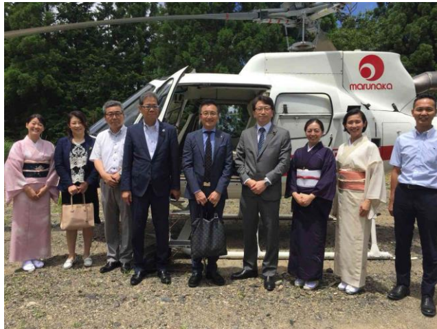
衆議院議員 平将明様をお迎えてV I P 対応を実践