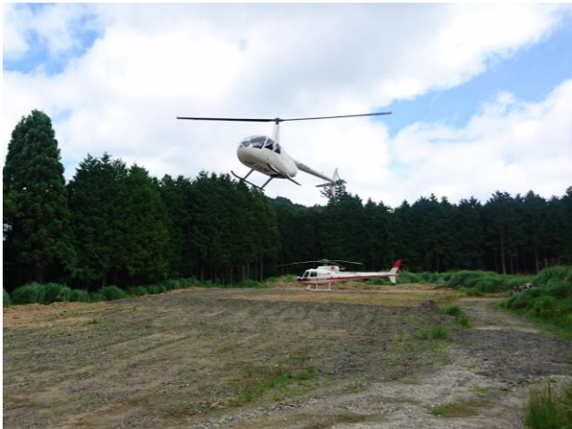
ヘリコプター2機の離着陸に十分な広さを確認