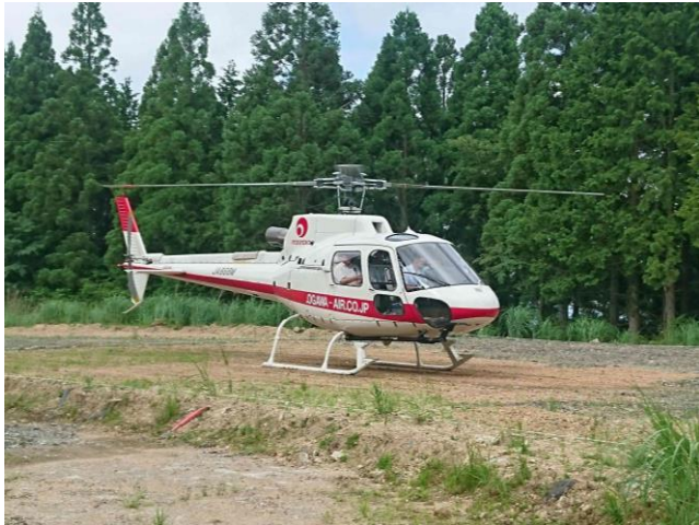
メイン駐機スペースに着陸した5人乗り機