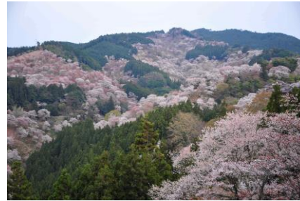
一目千本茶屋からの景観