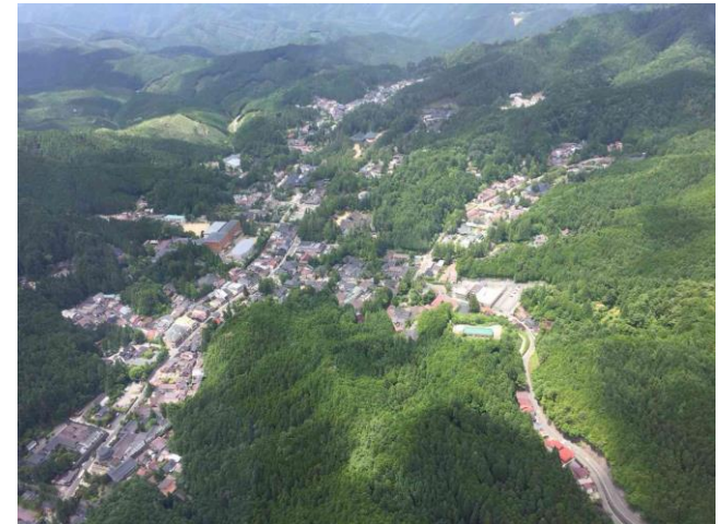
美しい高野山の全景