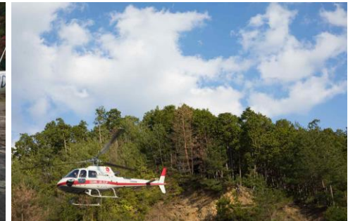
5人乗りヘリコプター